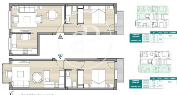
Plano (2) Orientación y circulación

Los datos de cada inmueble no son parte de una oferta o contrato. No debe considerar exactos o factuales las declaraciones hechas por aProperties, verbalmente o por escrito, respecto del inmueble, el estado en que se encuentra o su valor. Las fotografías sólo muestran partes determinadas del inmueble tal y como eran en el momento que se tomaron. Las áreas, dimensiones y las distancias que se proporcionan sólo son aproximadas y deben ser comprobadas por el cliente. Las imágenes generadas por ordenador solo son una indicación de la posible apariencia del inmueble, y pueden cambiar en cualquier momento. La información respecto a un inmueble es susceptible de cambiar en cualquier momento.