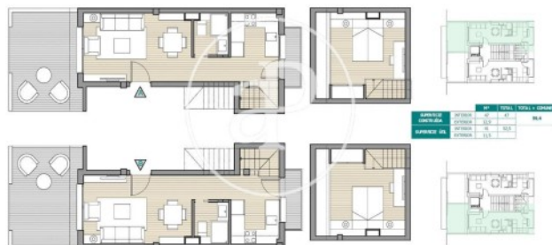
Plano (2) Orientación y circulación